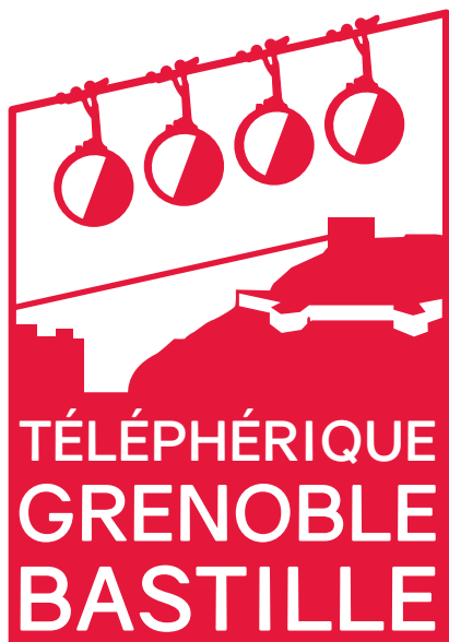
Logo Pantone couleur : 185 C