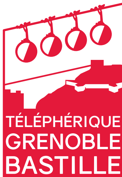
Logo quadri C = 1 # df002d M = 100 R = 223 J = 78 V = 0 N = 3 B = 45