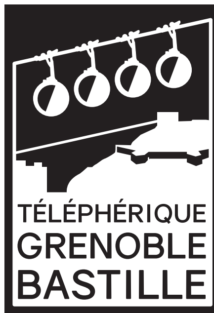
Logo gris C = M = J = N = 15