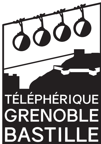
Logo noir C = M = J = N = 100