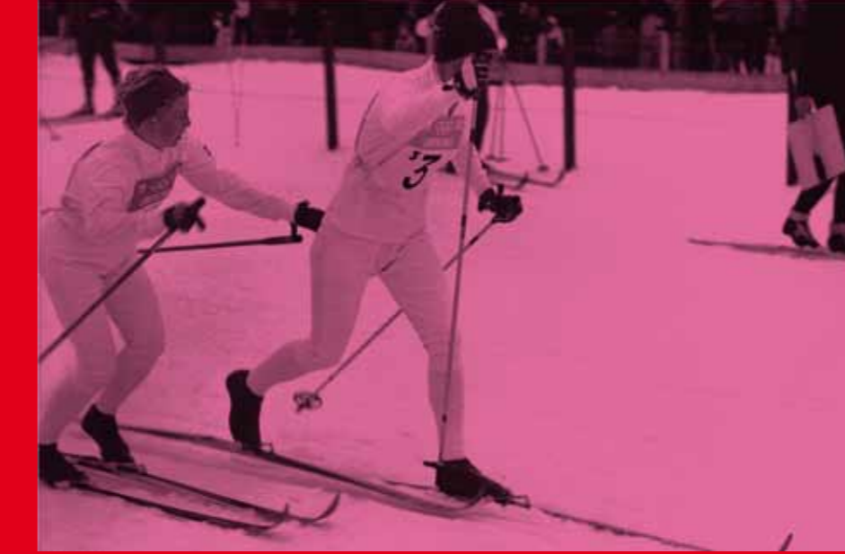
Au cœur du Vercors, à Autrans, se déroulent les épreuves nordiques. The Nordic events took place in Autrans, in the heart of the Vercors.