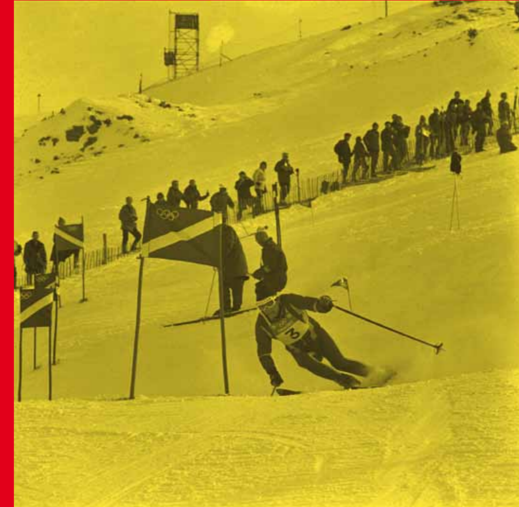
Sur les pistes de Chamrousse, Jean-Claude Killy remporte trois médailles d'or ! Jean-Claude Killy won three gold medals on the slopes of Chamrousse !

Le 6 février 1968, Grenoble est entrée dans le club des cités olympiques. Les innovations médiatiques, sportives, culturelles, artistiques, ... développées durant l'organisation de ces XX e Jeux Olympiques d'hiver ont été le fait des avancées technologiques, de la formidable énergie et surtout de la créativité de tous les acteurs grenoblois. Plus de 40 ans après, les traces de cet héritage sont nombreuses et sont inscrites durablement dans le paysage urbain. Certaines sont classées au patrimoine architectural du XX e siècle. Cet évènement aura grandement participé à l'inscription de Grenoble comme ville internationale.