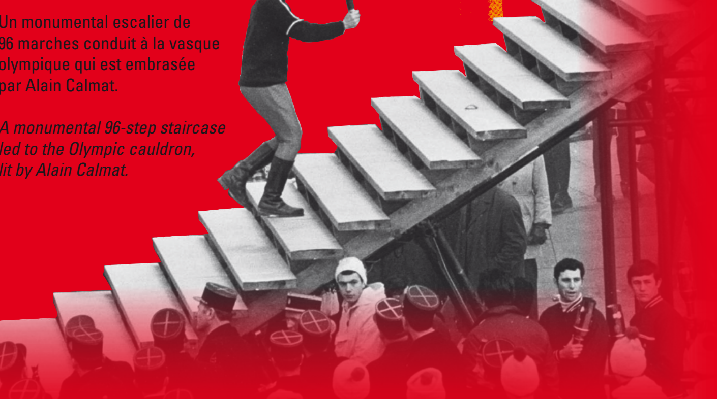
Un monumental escalier de 96 marches conduit à la vasque olympique qui est embrasée par Alain Calmat.