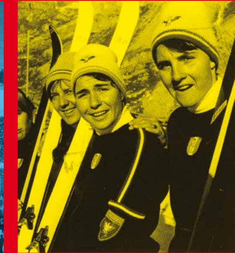
Christine et Marielle Goitschel