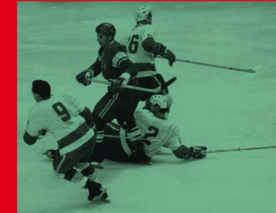
Hockey sur glace, rencontre URSS-CANADA Ice hockey, the USSR-CANADA game