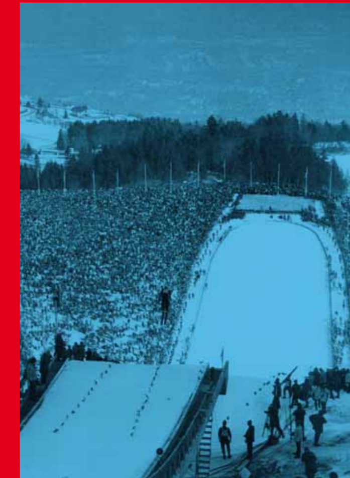
Tremplin de saut de St-Nizier - Ski jump in St-Nizier