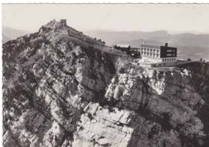
Hôtel Ermitage, au sommet du Moucherotte, rasé en 2001

Tout à la fois culturelle et touristique, la randociné vous donnera les clés de lecture de ce paysage que vous pensiez connaître et que vous allez redécouvrir.